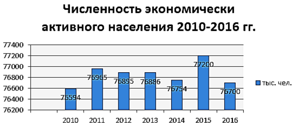
Рис. 1. Численность экономически активного населения 2010–2016 гг.

На рисунке показана численность экономически активного населения с 2010 по 2016 годы.