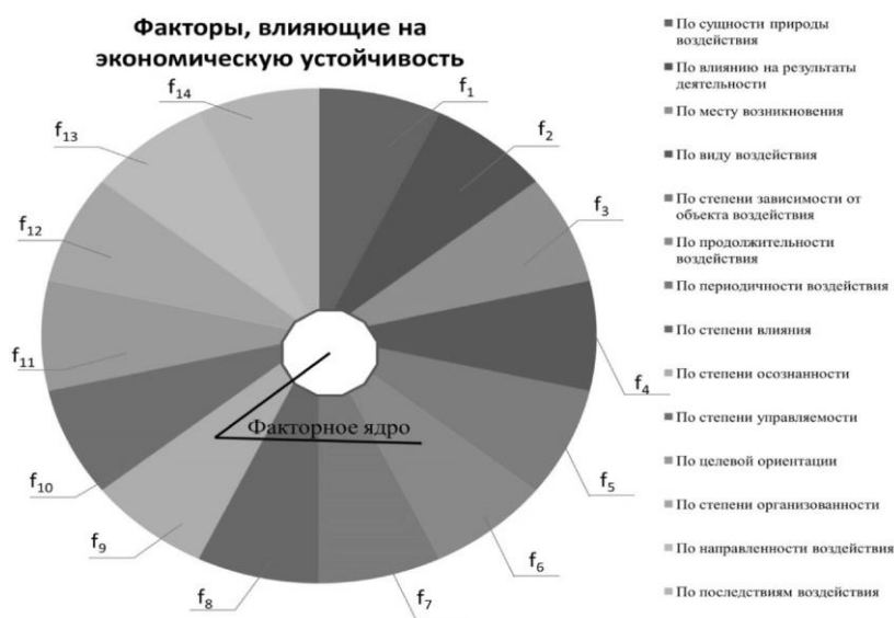
Рис. 2. Классификация факторов, влияющих на экономическую устойчивость