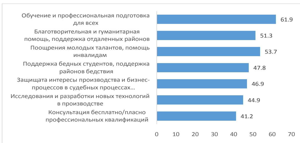
Рис. 2: Понимание содержания гражданского общества (%) [3, с. 115]

Обучение и образование, обеспечивающие профессиональные знания для групп населения, являются самым известным содержанием работы, при котором регистрируется 61,9% выборки. И благотворительная и гуманитарная помощь, поддержка развитию в дистанционных местах и мероприятия по продвижению молодых талантов являются 59,3% и 53,7% (рис. 2).