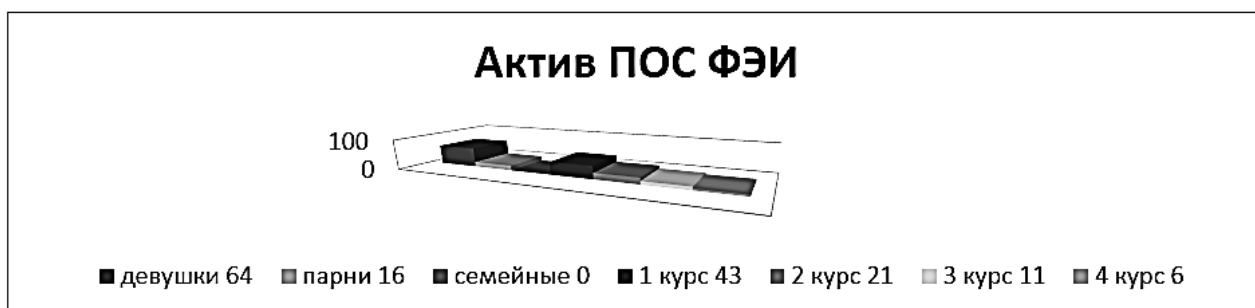
Рис. 1. Исследование методом анкетирования