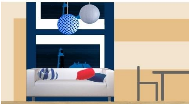
Рис. 3. «Коллаж-развертка» (студенческая работа)

подачи развертки при проектировании интерьера. Цветовая гамма коллажа определяет морскую тематику, которой обучающийся придерживается и в окончательной визуализации помещения.