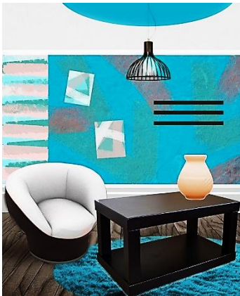
Рис. 1. «Коллаж-концепция» помещения жилого интерьера – гостиной (студенческая работа)

Рисунок 1 представляет студенческую работу – «коллаж-концепцию» помещения жилого интерьера – гостиной. В нем найдено цветовое решение будущего интерьера, подобраны мебель и другие аксессуары, определена стилистика помещения однокомнатной квартиры.