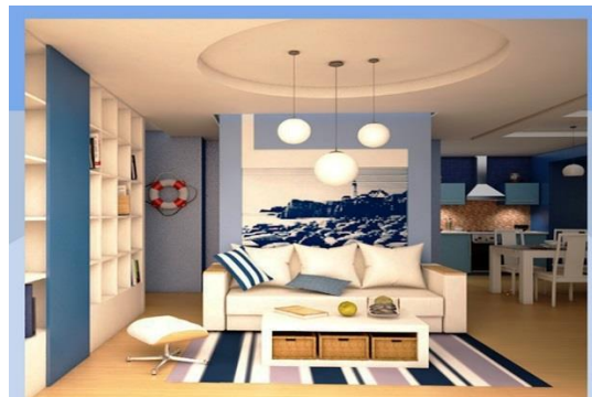
Рис. 4. Визуализации помещения

Упражнение «коллаж-нюанс» предполагает выполнение студентами многовариантных подходов к заключительному этапу декорирования интерьера. На этом этапе выбирается оптимальная стилистика и цветовая гамма помещения, базовая подборка мебели и аксессуаров.