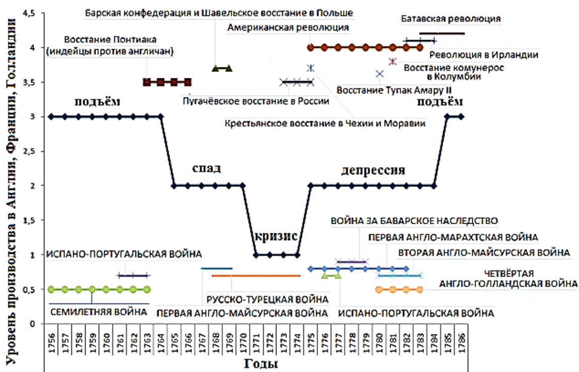
Рис. 1. Революции и восстания на фоне экономического цикла и войн (период мануфактурного спада)

который вызвал всплеск протестной активности в «ядре» и на «периферии» мир-экономической системы. Поэтому нижней границей данной работы будет именно середина XVIII в.