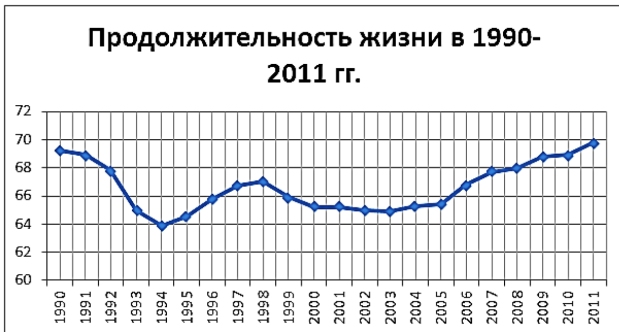
Рис. 2. Уровень продолжительность жизни населения в период 1990–2011 гг. [2]

Далее следует рассмотреть уровень продолжительности жизни в период 1990 по 2011 года, чтобы полностью рассмотреть, насколько он упал в период ухода от программы ГТО.