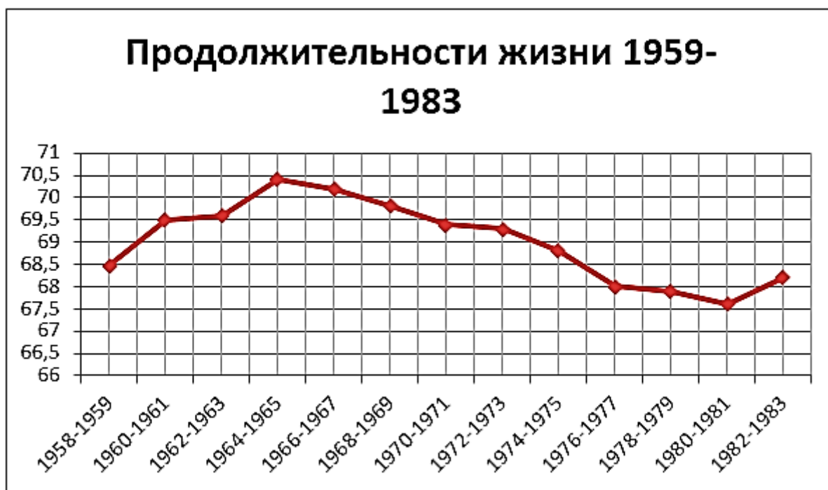
Рис. 1/ Уровень продолжительности жизни населения в период 1959–1983 гг.

Одной из немаловажных факторов, повлиявших на это решение, это увеличение уровня смертности от разного рода заболеваний в период ухода программы ГТО и сокращение уровня средней продолжительности жизни населения. На следующем графике можно представить продолжительность жизни населения в период 1959 – 1983 года.