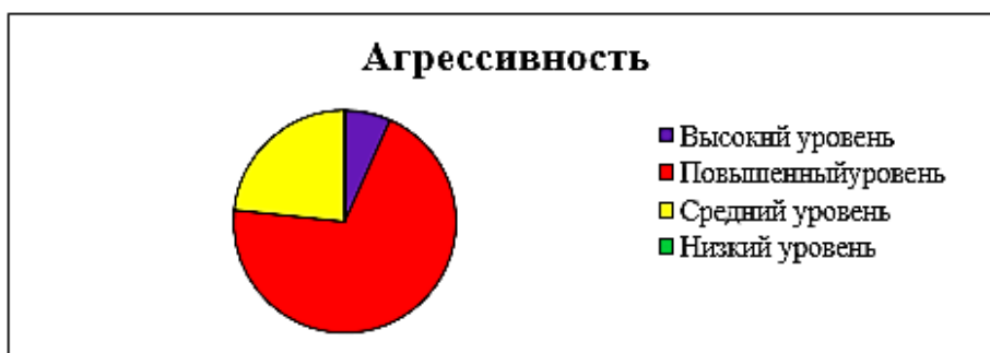
Рис. 4. Уровень агрессивности (в %)

Результаты на рис. 3, показывают, что в исследуемой группе преобладает повышенный уровень враждебности. Высокий уровень враждебности отмечается у 6,7% подростков, повышенный уровень враждебности характерен для 53,3% испытуемых, средний уровень выявляется у 36,7%, низкий – 3,3.