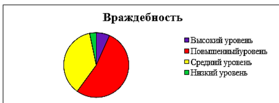
Рис. 3. Уровень враждебности (в %)

По полученным результатам методики определения уровня агрессии Басса-Дарки, нами бы рассчитан уровень враждебности и агрессивности испытуемых по приведенным выше формулам. Полученные результаты представлены на рис. 3, 4.