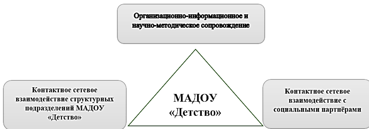
Рис. 1. Система сетевого взаимодействия МАДОУ «Детство»