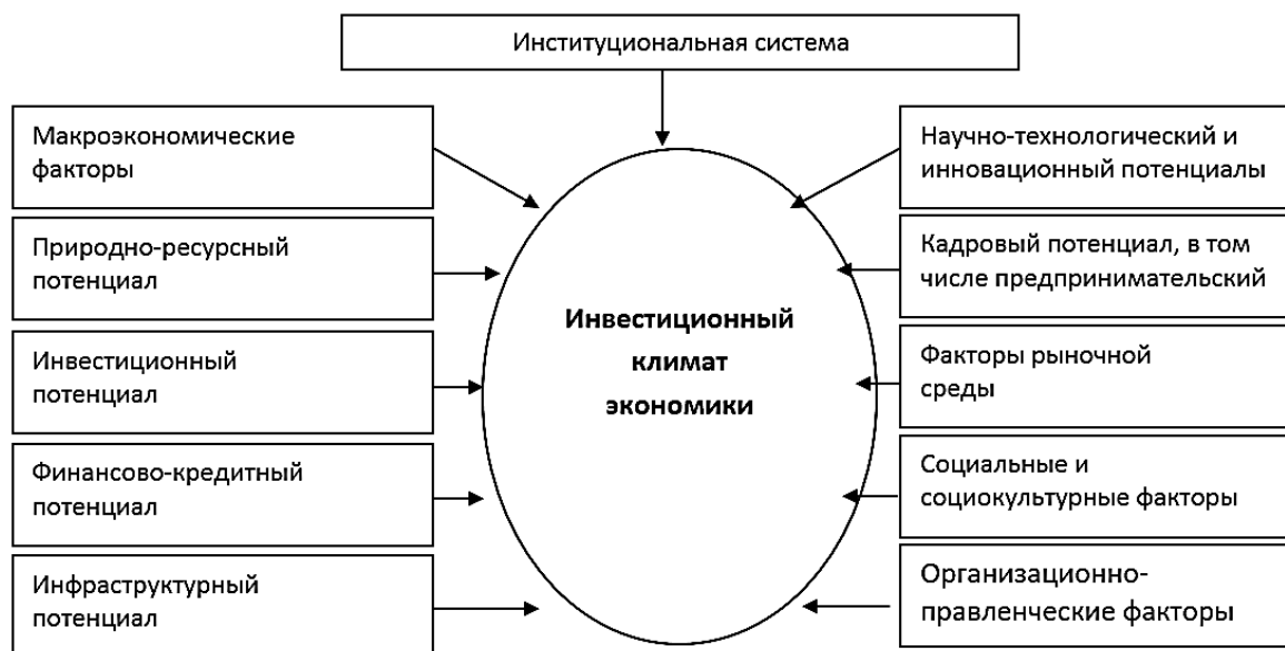
Рис. 1. Факторы, влияющие на инвестиционный климат экономики

Составлено автором по данным: Ласкин А.Г., Летук Б.Б. Инвестиционный климат в России в условиях глобализации // ЭКО. – 2015. – №3. – С. 35.