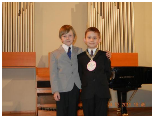
Рис. 9. После концерта (я слева)

Таким образом, история Немецкой улицы – проспекта Кирова отражает развитие нашего города, с ней тесно связана история и моей семьи.