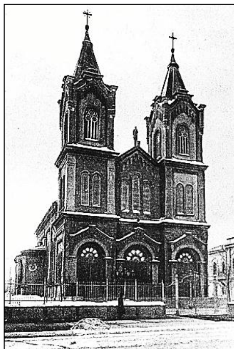
Рис. 2. Католический собор

До 1925 года на картах Саратова ещё не указывалась Немецкая улица, но постепенно здесь формировалась центральная часть города. Именно здесь было построено здание Присутственных мест, где размещался аппарат губернатора