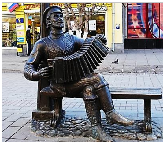
Рис. 5. Скульптура «Саратовская гармошка»

Есть здесь и памятник песне «Огней так много золотых на улицах Саратова...», которая считается неофициальным гимном нашего города (рис. 6).