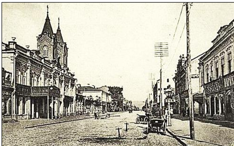
Рис. 3. Общий вид Немецкой улицы

Второй квартал Немецкой улицы (от нынешней улицы Горького до улицы Вольской) заселили военнопленные солдаты и офицеры французской армии Наполеона, принявшие русское подданство. Также здесь проживали ремесленники-колонисты, занимавшиеся производством ткани «сарпинка», и вновь прибывающие в город иностранцы.