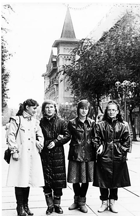
Рис. 8. Проспект Кирова – пешеходная зона (1985 г., крайняя справа – моя мама)

В середине 1980-х годов проспект Кирова стал пешеходной зоной Саратова, любимым местом отдыха молодёжи (рис. 8).