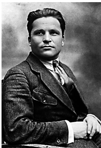
Рис. 4. Портрет С.М. Кирова (1886–1934 гг.)

Советское правительство в 1917 году присвоило улице имя Республики. Это название: улица Республики – продержалось почти два десятилетия. В 1935 году улица стала проспектом Кирова – в честь революционера Сергея Мироновича Кострикова, псевдоним которого был «Киров» (рис. 4).