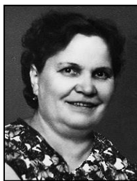
Рис. 7. Моя прабабушка на работе в стоматологической клинике, располагавшейся на пр. Кирова (1969 г.)

В середине 1980-х годов проспект Кирова стал пешеходной зоной Саратова, любимым местом отдыха молодёжи (рис. 8).