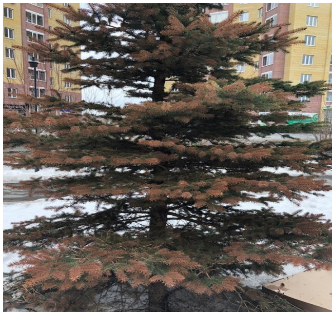
Рис. 2. Состояние ели в сквере Молодежный

Такое различие в состоянии елей обусловлено расположением этих скверов, а также транспортной нагрузкой на зеленые насаждения, так как сквер Победы находится во дворе, а Молодежный около торгово-развлекательного центра. Поэтому при планировании посадок целесообразно учитывать не только архитектурно-художественную составляющую, но и особенности планировки и застройки участка, а также устойчивость зеленых насаждений к загрязняющим веществам. Необходимо регулярно проводить мониторинг зеленых насаждений города, при необходимости, проводить санитарную вырубку.