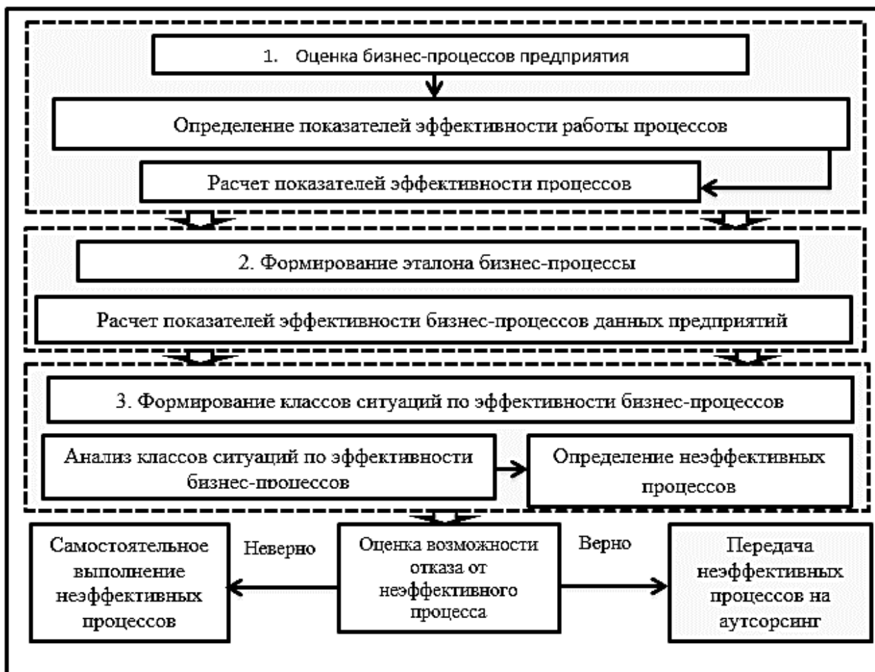
Рис. 2. Условия эффективности производственной деятельности предприятия и выделения неэффективных процессов с целью их передачи на аутсорсинг