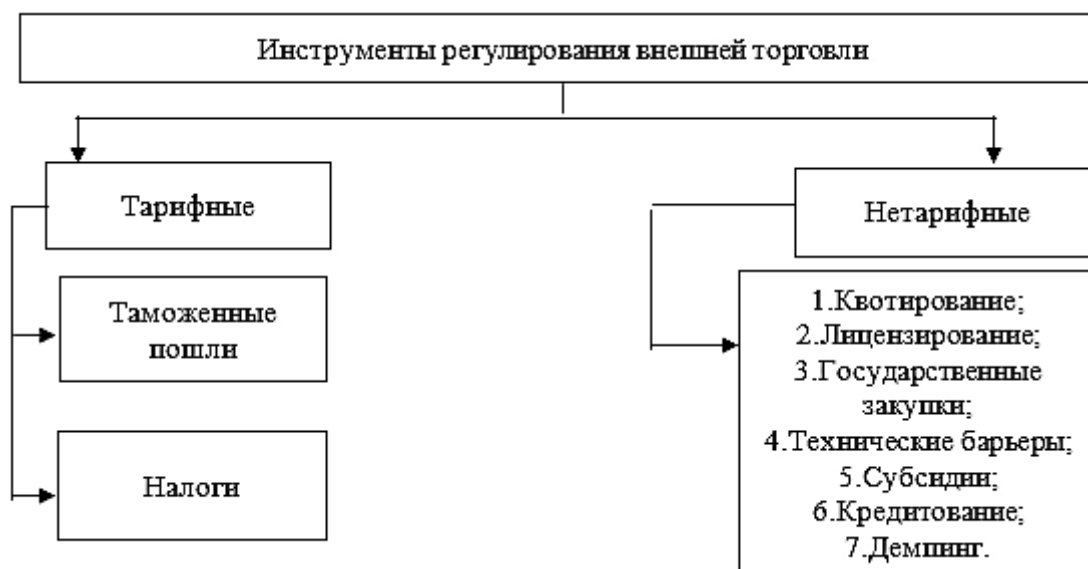
Рис. 1. Классификация инструментов тарифного и нетарифного регулирования