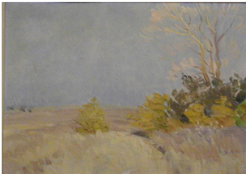
Рис. 3. Картина А.К. Гродскова «Осенняя пора», 1993

этого живописца отличаются ясностью очертаний, мягкостью освещения, ощущением задумчивой тишины.