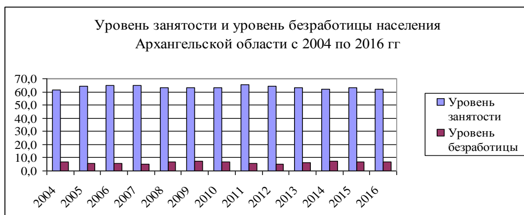
Рис. 2. Динамика уровня занятости и безработицы населения Архангельской области с 2004 по 2016 г.

Рассмотрим динамику уровня занятости и уровня безработицы населения Архангельской области с 2004 по 2016 г.