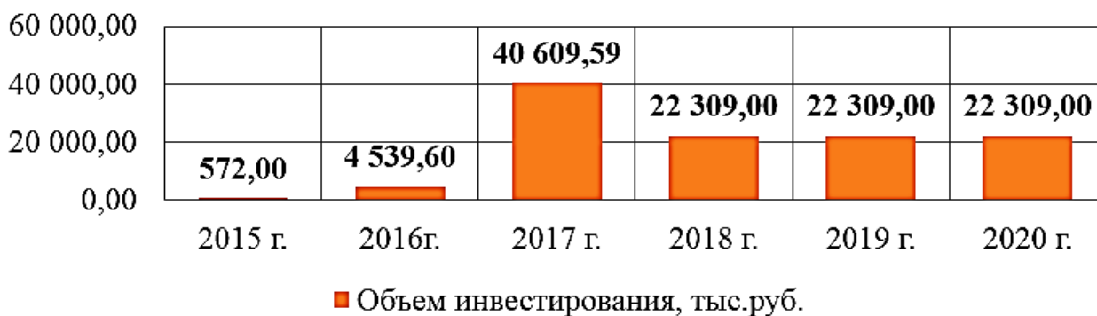
Рис. 2. Объем финансирования на развитие внутреннего туризма

Общий объем финансирования по государственной программе [1] на развитие внутреннего туризма на 2015–2020 гг., представлен на рисунке 2 и составляет 112 648,19 тысяч рублей за счет областного бюджета.