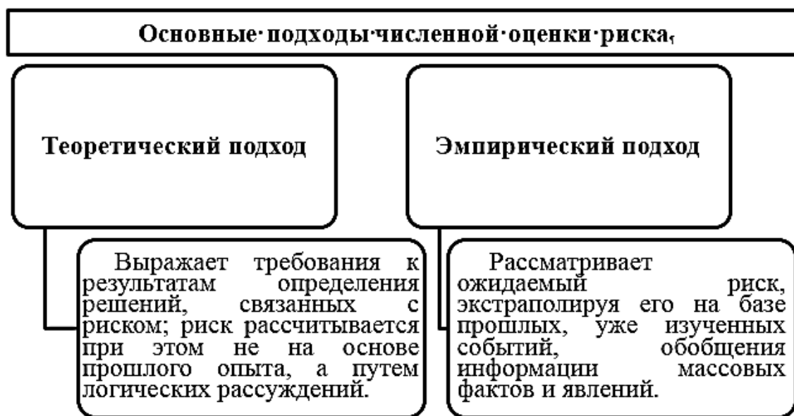
Рис. 1. Основные подходы численной оценки величины риска

Существуют различные методы и способы численной оценки предпринимательского риска. На практике их разделяют на два основных подхода. Рассмотрим их на составленной авторами ниже схеме с пояснениями (рис. 1).