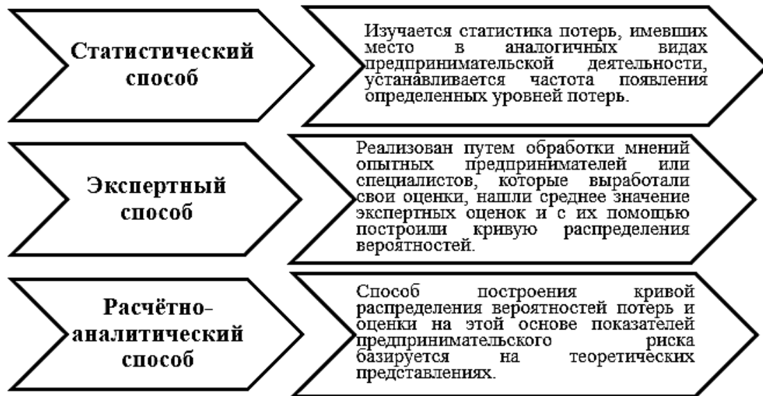
Рис. 2. Способы оценки предпринимательских рисков

Кроме того, существует национальный стандарт ISO/IEC 31010:2009, который служит методическим ориентиром в оценке риска. В соответствии с данным стандартом, оценкой риска является процесс идентификации, анализа и сравнительной оценки риска. Кроме того, оценка может проводится как для отделов организации, так и для всей организации в целом. В связи с этим, применяются разные методы оценки. Сам процесс более наглядно можно увидеть на следующей схеме (рис. 3) [1].