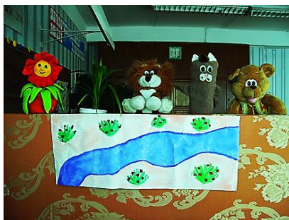
Рис. 1. Кукольный спектакль «Почему мы бодем?»

«Дорогие ребята! Я желаю вам здоровья! Это самое ценное, что есть у человека, а значит, его надо беречь. Вы, ребята, это хорошо знаете. А почему люди болеют? Вспомним путешествие ручейка».