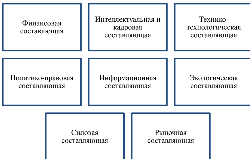
Рис. 2. Основные составляющие экономической безопасности предприятия

Финансовый результат является экономическим итогом функционирования предприятия, разницей между доходами и расходами компании и показателем ее эффективности и конкурентоспособности. Получение прибыли, сохранение ее уровня и устойчивого роста выступают важнейшим направлением деятельности предприятия.