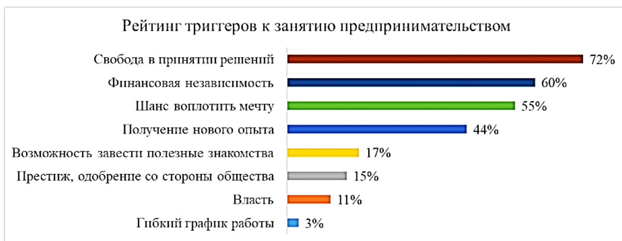
Рисунок 1. Рейтинг триггеров к занятию предпринимательством.

действующего предпринимателя главными триггерами, вдохновляющими на продолжение предпринимательской деятельности, является финансовая независимость и возможность воплотить мечту. Глубинное интервью с сотрудником по найму показало, что в своей работе по найму респондент считает главным недостатком ограниченность в принятии стратегических решений. Респондент также отметил, что именно это он считает главным преимуществом частного предпринимательства (поясняя, что одинаково высокого уровня заработной платы можно достичь в независимости от выбора формы занятости). Такая позиция респондентов полностью поддерживает результаты проведенного опроса широкой аудитории, которые показали, что три самых важных стимула к занятию предпринимательством – это свобода в принятии решений, финансовая независимость и шанс воплотить мечту (рисунок 1).