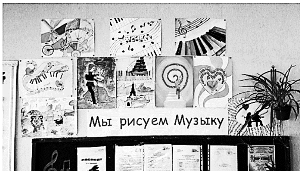
Рис. 1. Выставка из рисунков учащихся «Мы рисуем музыку»

Также – оформили выставку книг о композиторах – чувашских, русских, зарубежных. Развернули передвижную портретную галерею композиторов-классиков. Эти действия потихоньку подводят учащихся к самостоятельной работе – работе творческой, умственной и впоследствии – к проектной и исследовательской.