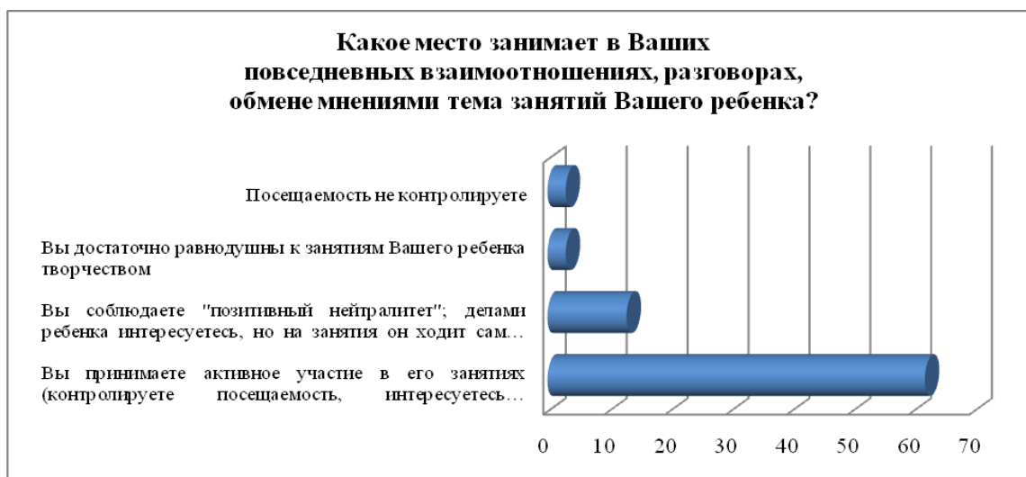
Рис. 3. Распределение ответов родителей на вопрос

«Какое место занимает в Ваших повседневных взаимоотношениях, разговорах, обмене мнениями тема занятий Вашего ребенка?»