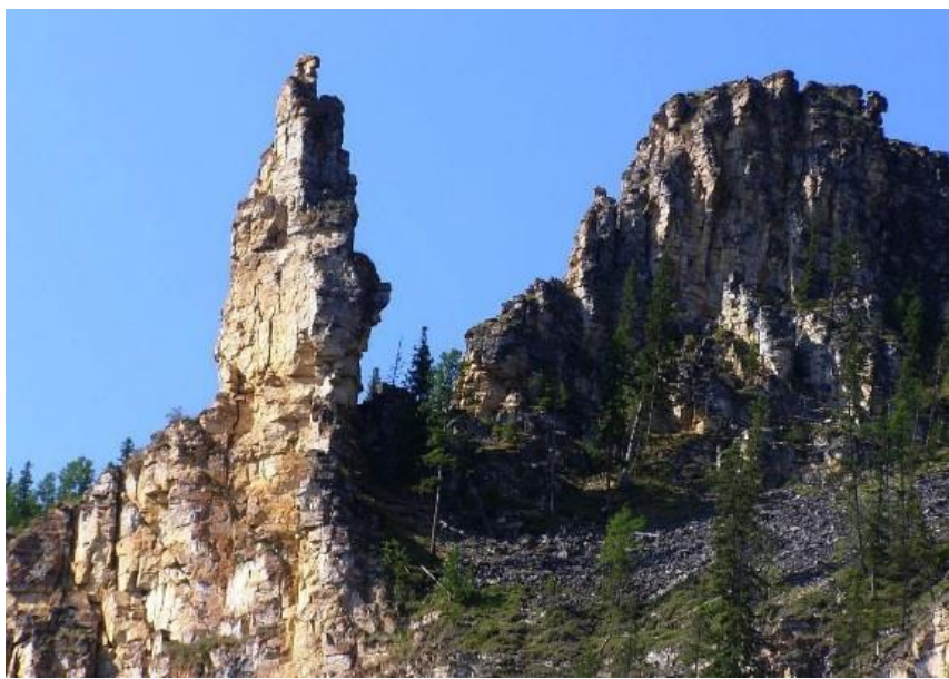
Рис. 5. Гора Ходар