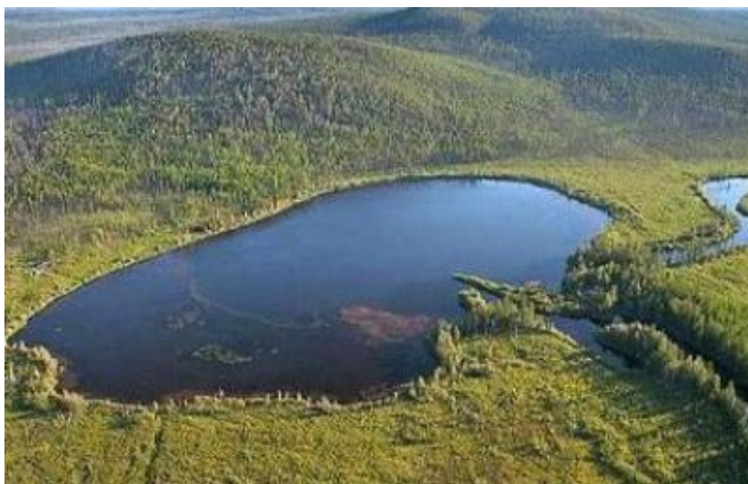
Рис 4. Озеро Лабынкыр