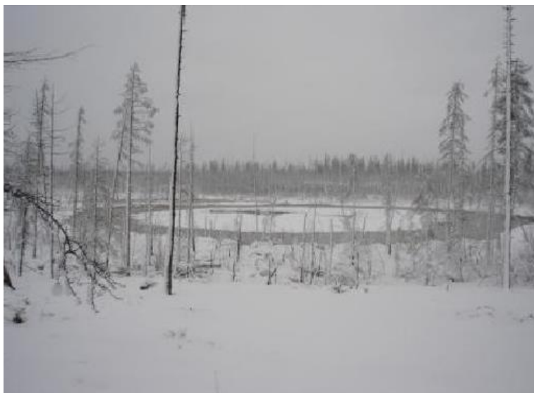
Рис. 2. Долина Смерти в Вилуйском улусе

которой скапливался газ, например, метан, отравление которым может привести к летальному исходу».