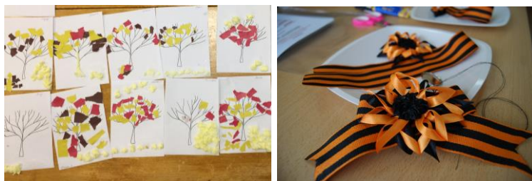
Рис. 1. Наши работы с детьми «От простого к сложному»

Я помогаю тем детям, которые испытывают затруднения, позволяю действовать в своем темпе и справляться с трудностями. Предлагая образцы деятельности, не настаиваю на точном воспроизведении детьми, поощряю индивидуальные работы. Направляю на самостоятельный поиск средств образной выразительности.