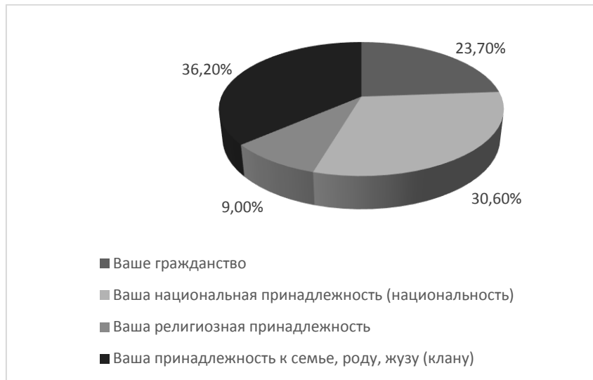
Рис. 1. Распределение ответов респондентов

Распределение ответов респондентов на вопрос «Расставьте по степени важности для Вас следующие понятия».