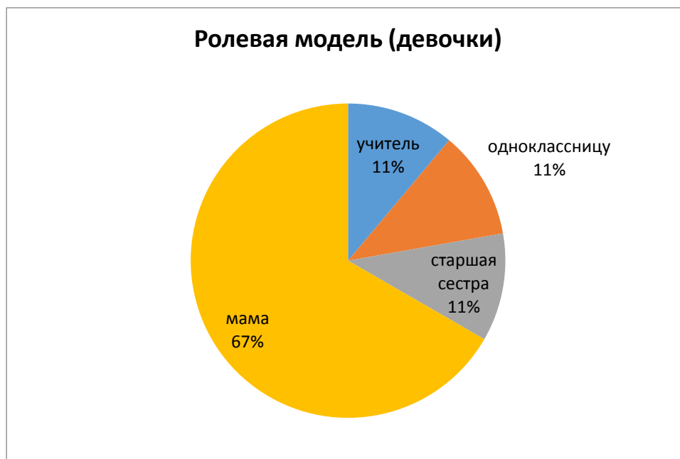
Рис. 2. Процентное распределение ролевой модели у девочек

Таким образом, большинство детей предпочитают походить на своего родителя, имеющего с ними один пол. Однако в качестве ожиданий дети в этом возрасте могут обозначить только внешние характеристики.