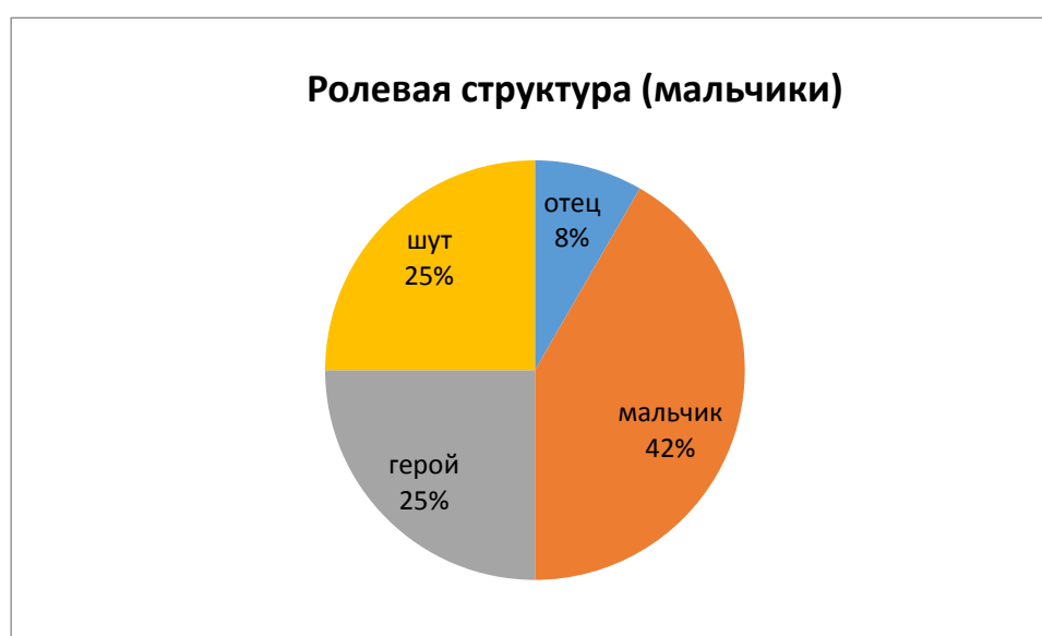
Рис. 5. Распределение по ролевой идентичности у мальчиков

Большинство мальчиков выбрало для себя соответствующую их возрасту роль мальчика (42%), с такими характеристиками, как похожа одежда, сам ребенок похож на ролевую модель мальчика, похожи волосы и красивый (рис. 5).