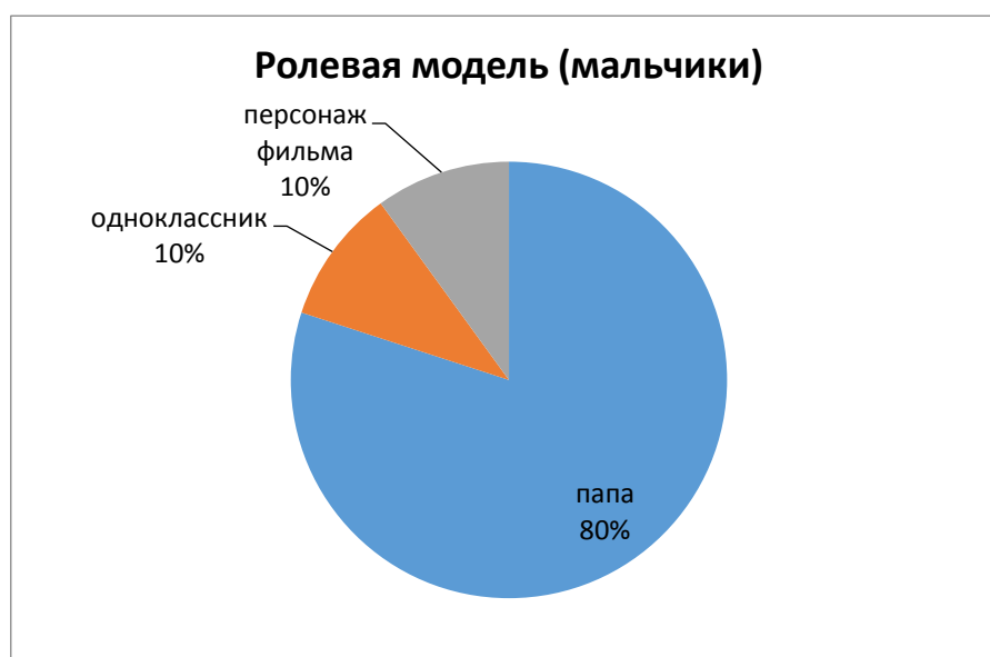
Рис. 1. Процентное распределение ролевой модели у мальчиков

Один ребенок назвал в качестве человека, на которого бы он хотел походить одноклассника, и один – персонажа из фильма (рисунок 1). Всего два ребенка смогли ответить, почему они хотят походить на отца. Один ребенок назвал силу, а второй обозначил, что он похож на отца внешне. В данном случае можно предполагать, что у мальчиков в данном возрасте преобладает в качестве ориентира отец. Вместе с тем, дети еще не способны выделить качества, по которым они смогли идентифицировать себя с отцом, а названные характеристики имеют внешний аспект.