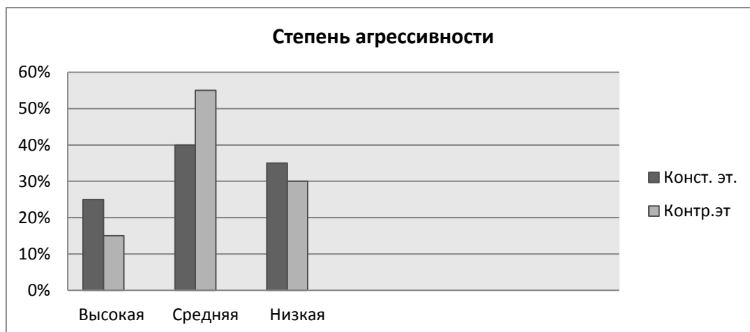
Рис. 2. Динамика снижения степени агрессивности в ЭГ

В экспериментальной группе снизилось количество подростков с высокой степенью агрессивности на 10%; со средней степенью увеличилось на 15%, за счет этого снизилось количество подростков с низкой степенью агрессивности на 5%. Главный результат мы видим в снижении количества подростков с высокой агрессивностью (рис. 2).