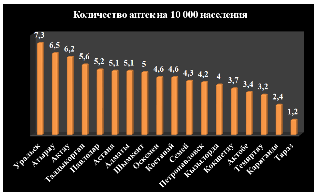
Рис. 3. Количество аптек в РК на 10000 человек [9]

Далее анализ проведенный «МедЭлемент» показывает, что на 100 тысяч жителей крупных городов РК приходится 53 аптеки [3]. На рисунке 3 представлено количество аптек на 10 000 населения.