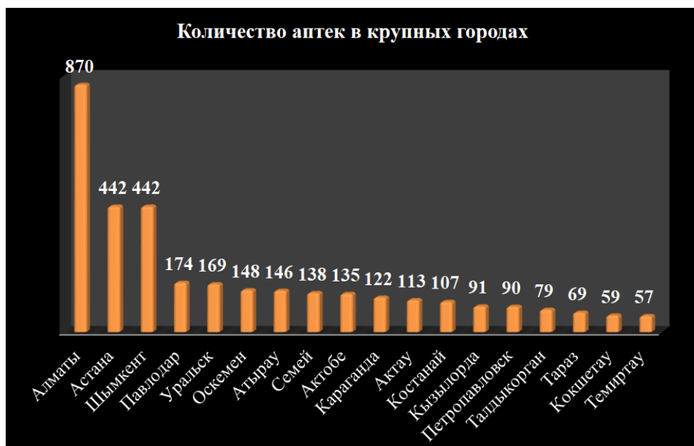
Рис. 2. Количество аптек в крупных городах РК

На основании исследования, проведенного Казахстанской медицинской платформой «МедЭлемент» (medelement.com), в 2018 году в крупных городах Казахстана было зафиксировано 3970 действующих аптек. На рисунке 1 представлено число аптек в крупных городах Казахстана.