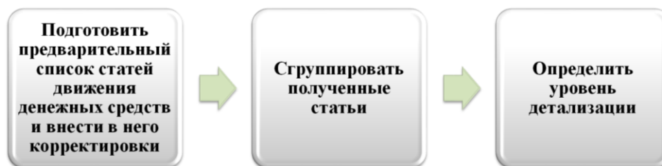
Рис. 2. Технология разработки бюджета движения денежных средств на основе бюджета доходов и расходов

Процесс формирования бюджета движения денежных средств на основе «бюджета доходов и расходов» предполагает порядок три этапа действий, представленный на рисунке 2.