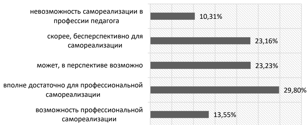
Рис. 3 Процентное распределение преподавателей колледжей по характеру оценки вероятности самореализации в педагогической деятельности.

Интерес представляют результаты анализа оценок преподавателями колледжей их возможности самоактуализации в психолого-педагогической деятельности (Рис. 3).