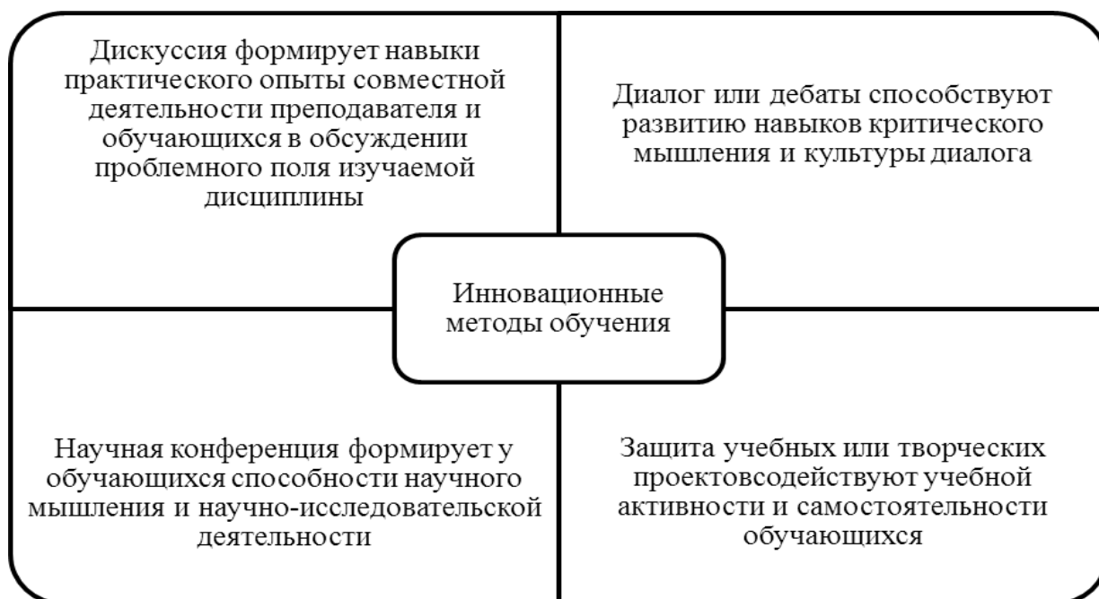
Рис. 3. Инновационные методы обучения