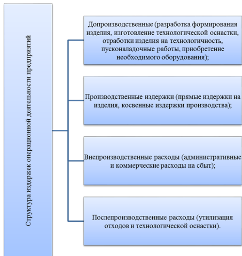
Рис. 3. Структура издержек операционной деятельности предприятий по стадиям жизненного цикла продукции

По результатам этого анализа формируется информация о сопоставимости издержек, признаваемых на производственной стадии жизненного цикла ассортиментной позиции, и других операционных издержек хозяйственной деятельности предприятий, признаются на производственную, внепроизводственную и послепроизводственную стадии жизненного цикла ассортиментной позиции [2].