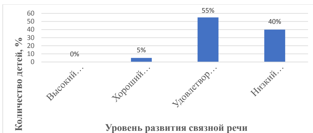
Рис. 1. Уровни развития связной речи на констатирующем этапе в экспериментальной группе

Проведя анализ речевой деятельности школьников по каждому виду заданий, мы распределили исследуемых экспериментальной группы по предложенным уровням следующим образом. В ходе обследования выяснилось, что детей с высоким уровнем сформированности связной речи в данной группе не выявлено.