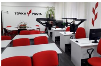
Рис. 3. Центр «Точка роста»

Итогом семинара стал круглый стол, где все участники мероприятия высоко оценили деятельность школы по открытию и работе Центра, уровень организации самого семинара, его актуальность и практическую значимость для руководителей образовательных организаций и Центров «Точка роста».