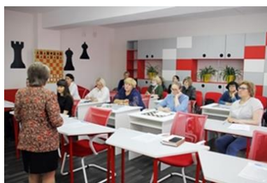
Рис. 1. Муниципальный семинар

14 мая 2021 года в МБОУ «СОШ №10» прошел муниципальный семинар «Роль руководителя образовательной организации в использовании возможностей Центра образования цифрового и гуманитарного профилей «Точка роста» в формировании новых компетенций у участников образовательных отношений». В семинаре приняли участие руководители, заместители руководителей общеобразовательных организаций г. Инты, руководители Центров «Точка роста»: МБОУ «СОШ №5», МБОУ «СОШ №6», МБОУ «СОШ №8», МБОУ «СОШ №9», МБОУ «СОШ №10», МБОУ «Лицей №1 г. Инты», МБОУ «Гимназия №2», МАОУ «Гимназия №3», МБУ ДО СЮН, представители МКУ «ГУНО».