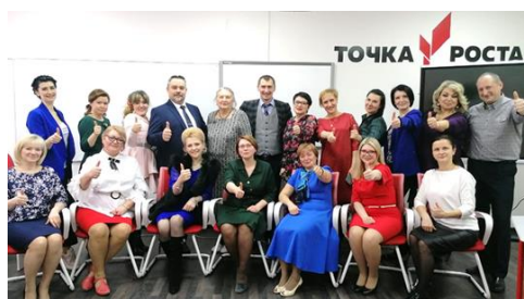
Рис. 4. Коллектив центра «Точка роста»

Перефразируя японскую пословицу, скажу: «Лучше один раз увидеть, чем сто раз услышать, но лучше один раз сделать самому, чем сто раз увидеть». Именно это даёт нам и нашим детям Центр «Точка роста».