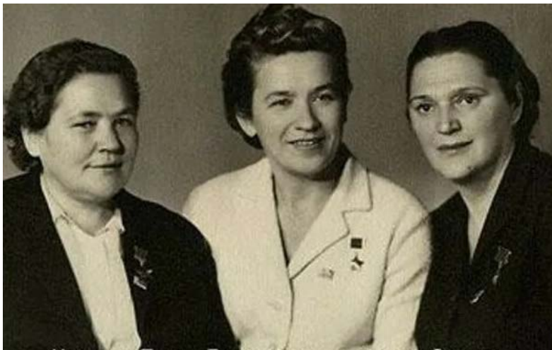
Рис. 8. М.Б. Осипова, Н.В. Троян, Е.Г. Мазаник (слева направо)

Звание Героя Советского Союза присвоено Надежде Викторовне Троян, Елене Григорьевне Мазаник, Марии Борисовне Осиповой.