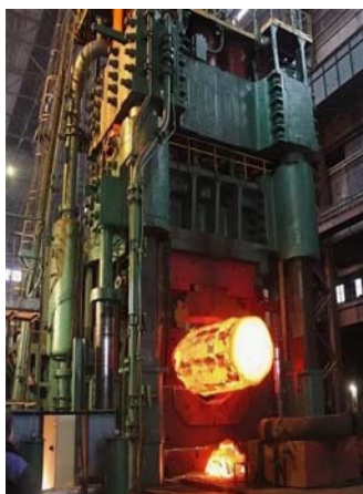
Рис. 2. Кузнечно-прессовый цех УЗТМ