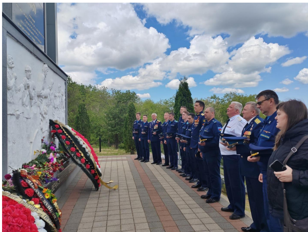
Рис. 1. У мемориала. [Электронный ресурс]. – Режим доступа:

были посещены памятники авиаторам -героям Советского Союза: бюст космонавта В.В. Горбатко и бюст лётчика-испытателя А.В. Федотова. Возле каждого памятника один из заранее подготовленных участников экскурсии рассказывал об истории его создания и биографии людей, связанных с ним. Завершало экскурсию посещение памятника Маршалу Советского Союза Г.К. Жукову, который получил первое звание красного командира именно в городе Армавире и спустя много лет, в должности Министра обороны СССР, посещал с инспекцией Армавирское военное авиационное училище лётчиков [3].