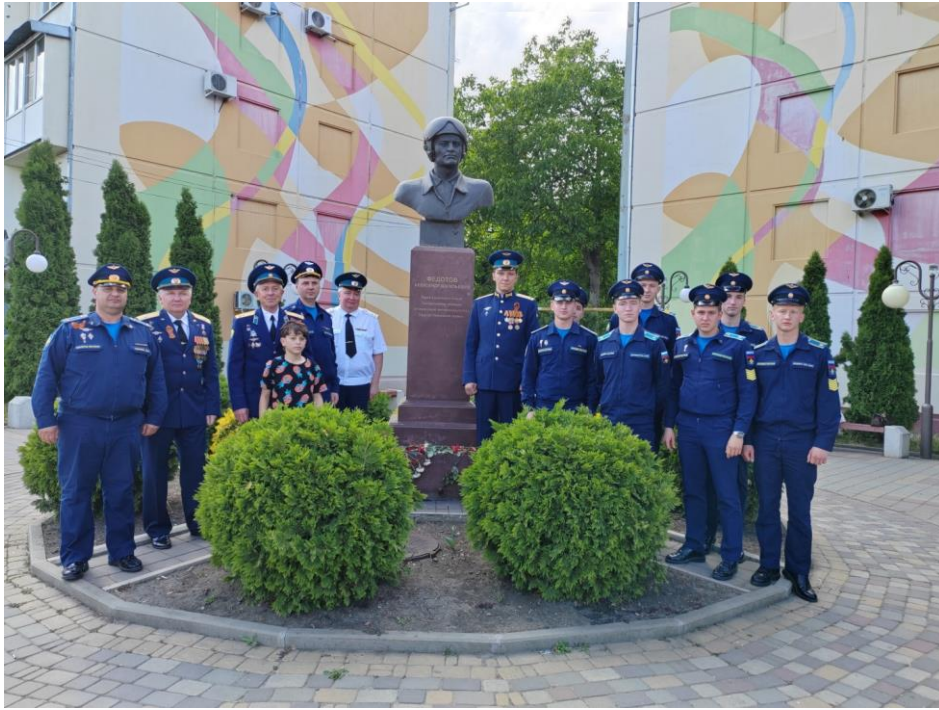
Рис. 2. У бюста летчика-испытателя А.В. Федотова [Электронный ресурс]. – Режим доступа: https://clck.ru/3CMfAf