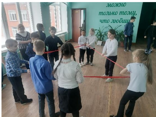
Рис. 5. Перемена

На 4 перемене играли в «Невидимый лабиринт» (рис. 6).