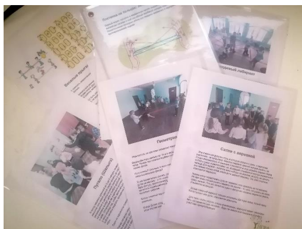
Рис. 7. Открытки

Ученикам нашего класса очень понравился марафон. Они попросили повторять подобные мероприятия. И с удовольствием продолжают играть в изученные игры. А для того, чтобы к нам могли присоединиться ученики и других классов, мы решили создать серию открыток с правилами различных игр с веревочкой в условиях школы (Рис. 7).