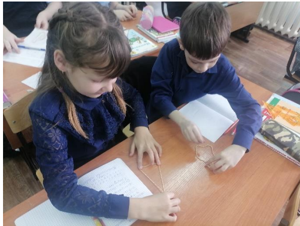
Рис. 4. Математика.

На уроке математики создавали разные геометрические фигуры из веревочки, рисовали с помощью нее окружность (Рис. 4).