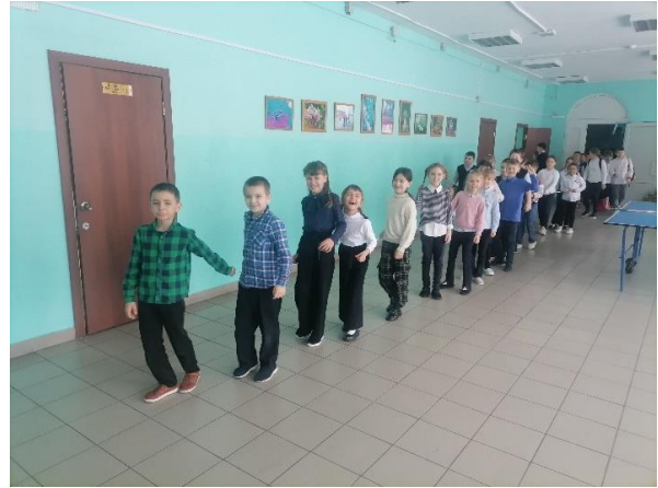
Рис. 3. Поход в столовую

На уроке русского языка писали текст о веревочке.