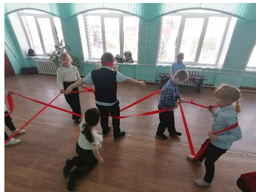
Рис. 6. Лабиринт

На уроке «Мир вокруг нас» смотрели очень трогательный мультфильм «Веревочки». А также учились показывать фокусы с помощью веревочки, играть в «Ниточку». Завершила наш марафон игра «Пугало (Шалыга)».