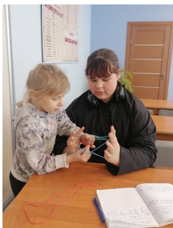
Рис. 1. Опрос

Виды творчества, связанные с веревочкой, тоже разнообразны. Например, макраме, плетение из лент, вязание, узелковая вышивка, плетение поясов. С ученицей были проведены несколько занятий, посвященных созданию славянского пояса на дощечках.