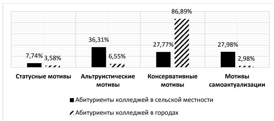
Рис. 3. – Процентные распределения абитуриентов двух исследовательских групп по преобладанию мотивов выбора профессии

Как видно из наглядного представления результатов процентного распределения абитуриентов двух исследовательских групп, мотивационные профили обучающихся аграрных колледжей достаточно различны.