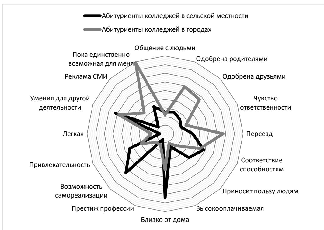
Рис. 2. – Мотивационные профили абитуриентов двух исследовательских групп

На рисунке 2 наглядно представлены усредненные мотивационные профили абитуриентов двух исследовательских групп.