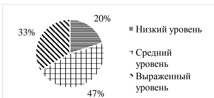
Рис. 2 – Результаты первичной диагностики адаптивности по методике «Оценка профессиональной адаптации работника» Р. Х. Исмаилова

Далее для первичной диагностики адаптивности нами была использована методика «Оценка профессиональной адаптации работника» Р. Х. Исмаилова (рис. 2).