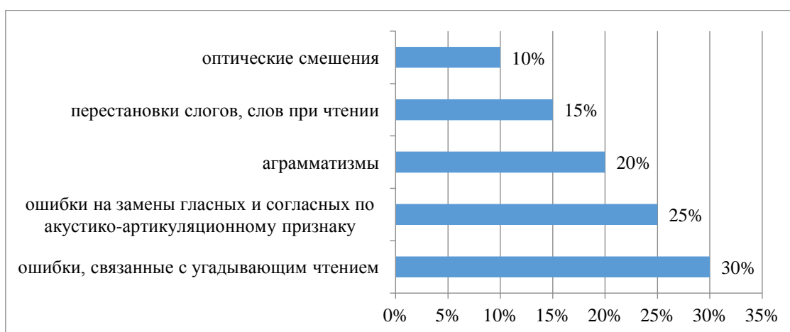
Рис. 2. Сравнительная характеристика ошибок чтения у детей

На рисунке 2 представлены сравнительные данные ошибок чтения у младших школьников данной группы.