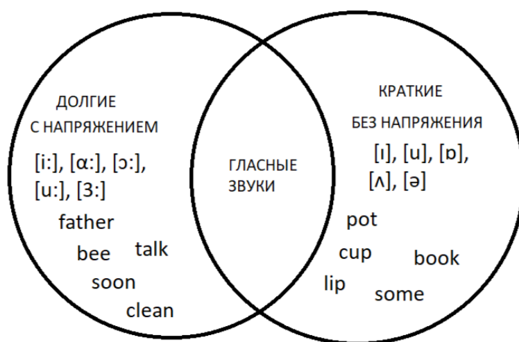
Рис. 1. «Кольца Венна» – гласные звуки

Такое упражнение способствует развитию навыков работы с информацией, её анализа и структурирования, а также позволяет наглядно проиллюстрировать сравнение долгих и кратких гласных звуков (см. рис. 1).