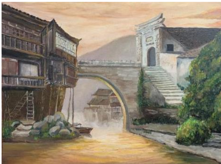
Рис. 3. Ван Хэнин «Вечернее очарование водного города»

Данная композиция посвящена традиционной архитектуре южного Китая и вдохновлена атмосферой старинных водных городов, таких как Учжэнь и Сучжоу, с их характерными арочными мостами, деревянными домами на сваях и спокойной гладью каналов. Выбор данного сюжета продиктован как личными художественными интересами, так и стремлением отразить национальные культурные корни в рамках академической живописи. В условиях учёбы за рубежом для автора было особенно важно сохранить связь с китайской культурной традицией, переосмыслив её средствами классического живописного языка. В работе автор стремился соединить архитектурную достоверность с поэтическим образом вечернего света, создающим ощущение тишины и уюта, характерное для водных городов. Работа над картиной велась поэтапно. На первом этапе был создан предварительный эскиз на бумаге, в котором определены общая композиция, пропорции и ритмическое распределение архитектурных форм.