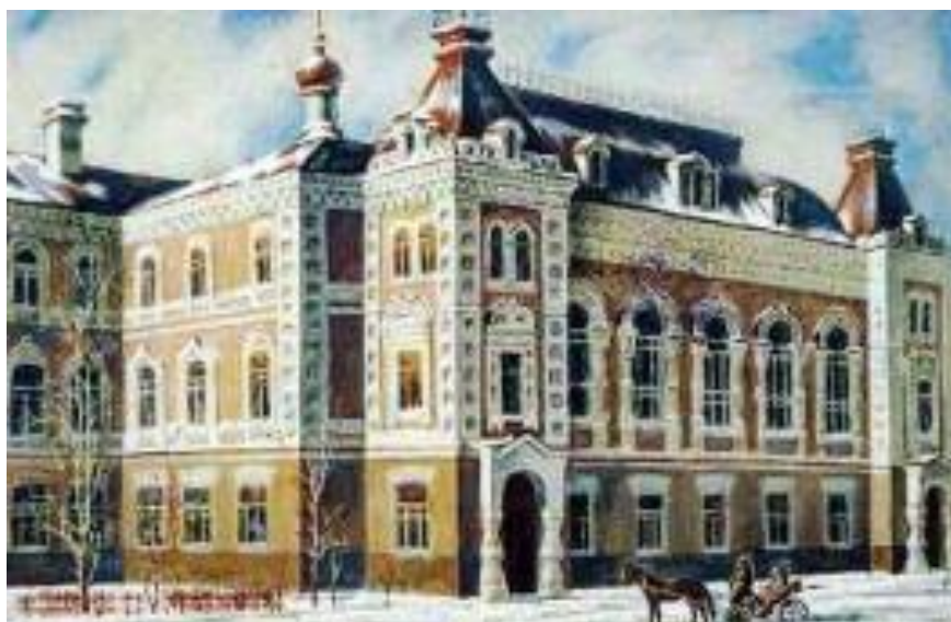
Рис. 2. Ю. Наконечный «Мужская гимназия»

На картинах этого художника Благовещенск – город, живший с купеческим размахом, по мостовым которого ездили коляски, по тротуарам прогуливались дамы в замысловатых шляпках и длинных платьях, кавалеры, опираясь на трости, задумчиво вглядывались в амурские дали. Этот город по своему духу был другим, неспешным, смешавшим в себе богатство и бедность, классику и модерн, просыпавшимся и засыпавшим под колокольный звон – из-за отсутствия высоких построек он был слышен даже на окраинах.