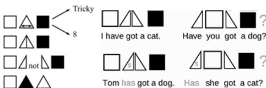
Рис. 1. Абстрактные символы

К абстрактным символам можно отнести геометрические фигуры. Использование геометрических фигур в учебном процессе наиболее распространено среди остальных визуальных средств.