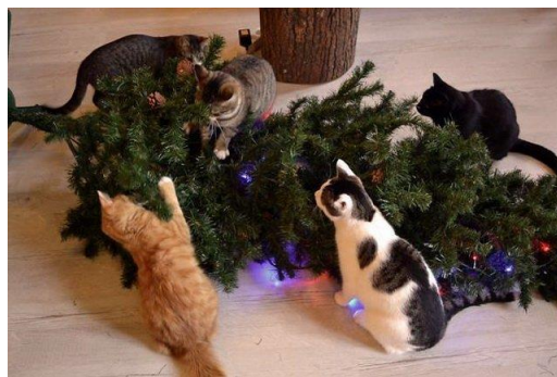
Рис. 2. Примеры возможных картинок для конкурса Acting Challenge

Команды по очереди изображают увиденное.