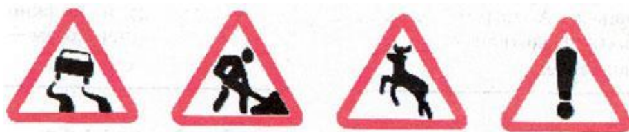
Рис. 1. Предупреждающие знаки