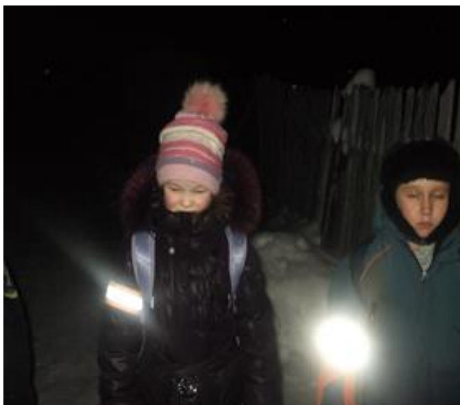
Рис. 5. Правильные фликеры