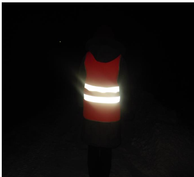
Рис. 4. Мама провожает в школу