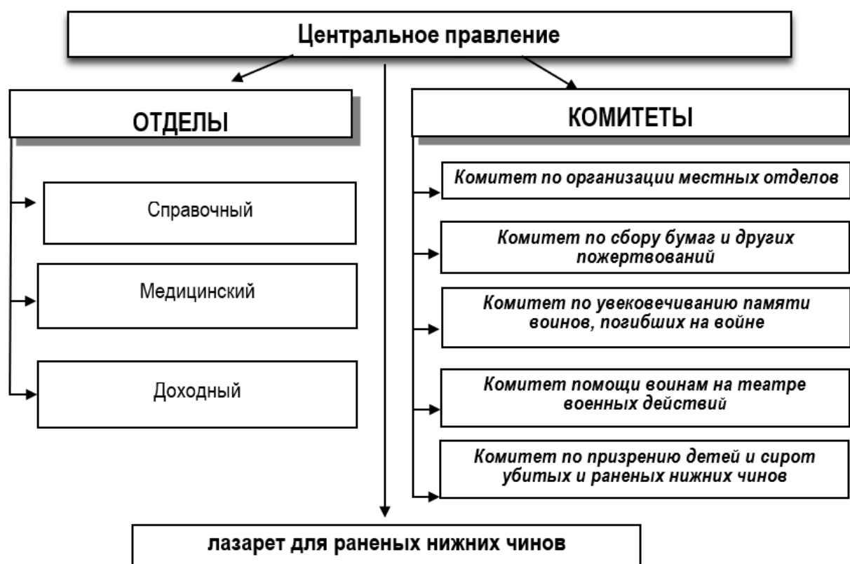
Рис. 2. Структура отделов и комитетов Общества повсеместной помощи пострадавшим на войне солдатам и их семьям на 1915 г.