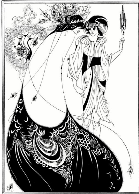
Рис. 1. О. Бердслей. Иллюстрация к пьесе О. Уайльда «Саломея». 1894г.

приводит к тому, что линейность может перейти в грубую схематичность и невыразительную «проволочность».