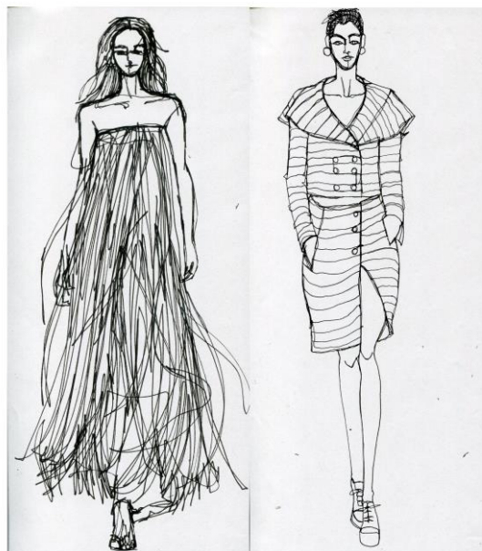
Рис. 6. Работы студентов в технике «Не отрываая руки»