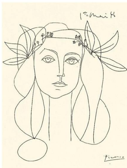
Рис. 3. П. Пикассо. Молодая девушка