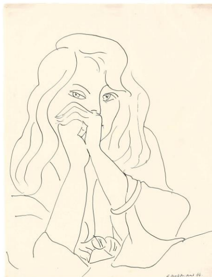
Рис. 2. А. Матисс. Женщина с распущенными волосами. 1944г.