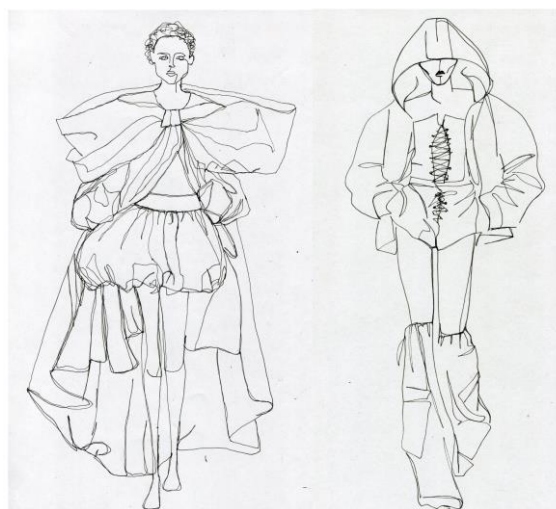
Рис. 5. Работы студентов в технике «Не отрываая руки»