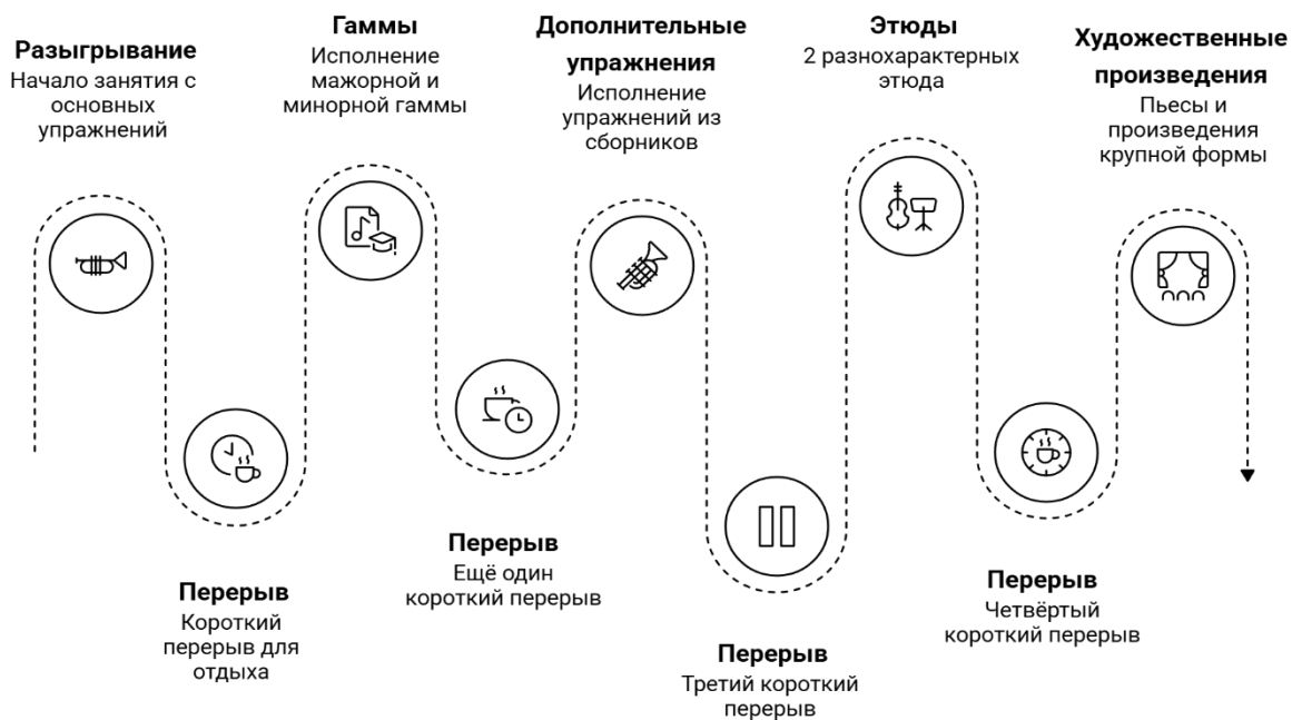
Рис.1. План самостоятельного занятия студента-трубача