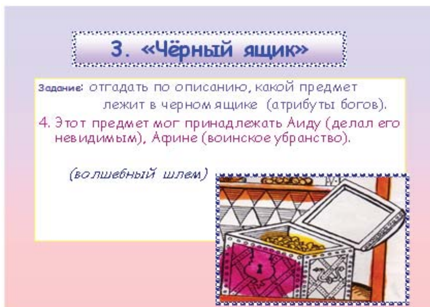
Рис. 2. Задание 3. «Черный ящик»

Вопросы задания прогнозируют формирование умений учащихся воспринимать и анализировать прочитанное, осознавать художественную картину жизни, отражённую в литературном произведении, на уровне не только эмоционального восприятия, но и интеллектуального осмысления.