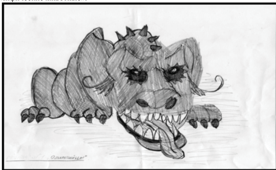
Рис. 3. Задание «Мифические животные»

Все мы любим разгадывать кроссворды, именно поэтому одно из заданий игры – кроссворд «Мифические животные».